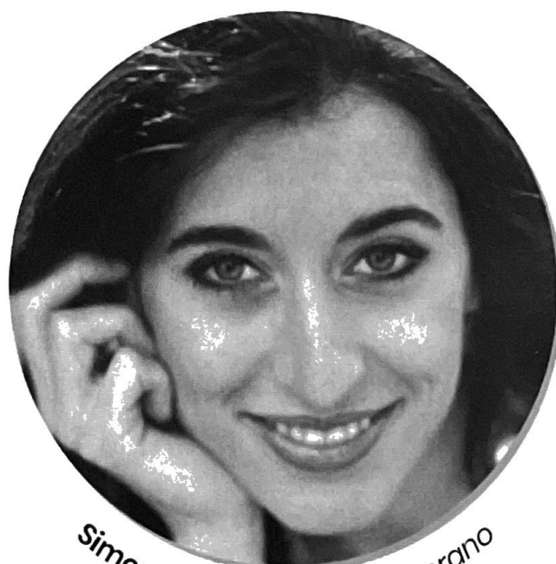
Simona Caressa, mezzo-soprano