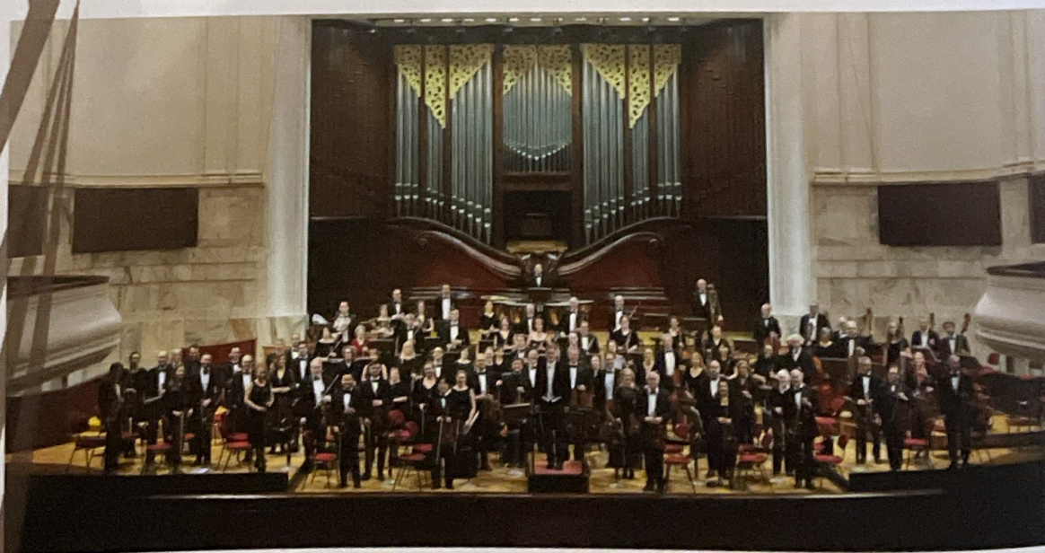
World Doctors Orchestra Warsaw 2018

Jusqu'à présent, WDO a collecté environ 1 million d'euros avec 27 séances de concert pour des organisations d'aide médicale. En outre, les musiciens participants ont indirectement contribué à hauteur de 2,5 millions d'euros en prenant en charge leurs frais de déplacement et de séjour.