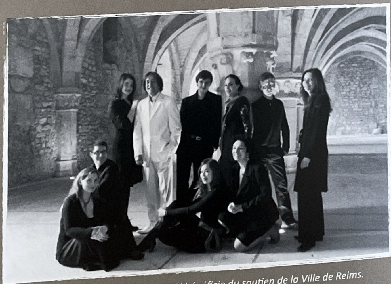
L'Ensemble des Solistes ALLEGRI bénéficie du soutien de la Ville de Reims.

Le premier concert de l'Ensemble ALLEGRI eut lieu à Guignicourt le 2 juillet 2011 avec un programme baroque, suivi de nombreuses autres prestations, en Picardie, Champagne-Ardenne, Nord-Pas-De-Calais, Lorraine et en Région Parisienne, dont un concert avec les Rolling Stones au Stade de France.