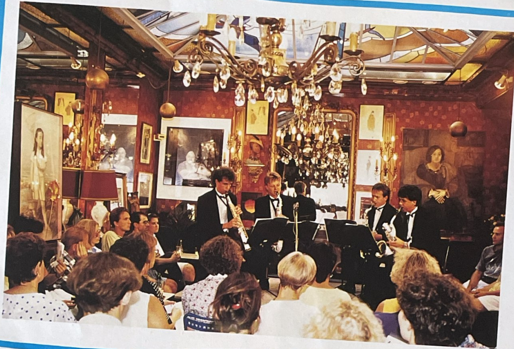
CAFE DU PALAIS Mardi 13 août Quatuor de saxophones de Versailles