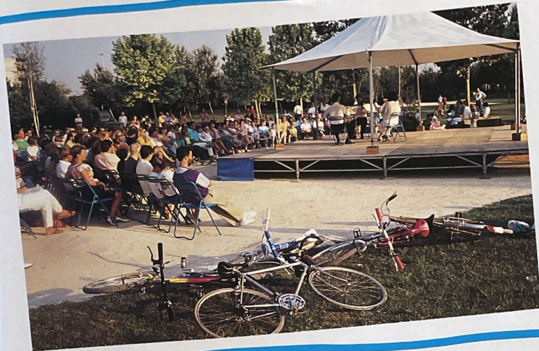
PLAN D'EAU MURIGNY Mardi 20 août Quatuor à cordes de Roumanie