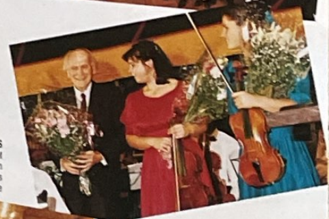
MAIRIE DE REIMS Lundi 29 juillet Sir Yehudi Menuhin salue les jeunes musiciens venus de toute l'Europe