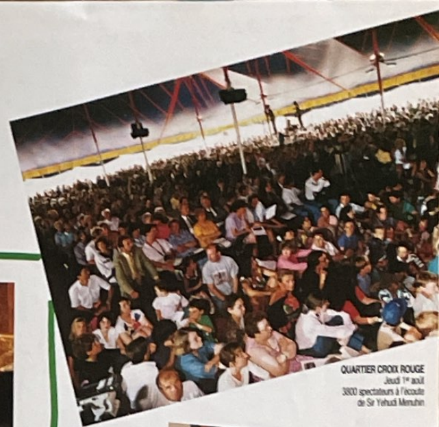
QUARTIER CROIX ROUGE Jeudi 1er août 3800 spectateurs à l'écoute de Sir Yehudi Menuhin