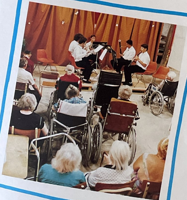
HOPITAL SEBASTOPOL Mardi 30 juillet Quintette à vent de Hongrie